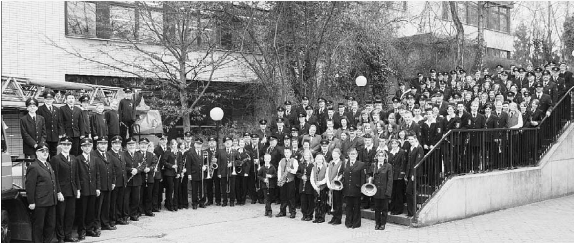
Ungefähr 200 Musiker werden auf der Bühne stehen beim Konzert aller Feuerwehr-Musik- und Spielmannszüge des Kreises Warendorf. Es findet statt am Sonntag, 23. April, in der Ennigerloher Olympiahalle.