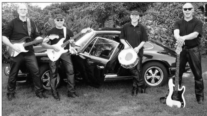
Ihre erste CD will die „Colorados Revival Band“ bei der Osterparty in Ostenfelde vorstellen. Am Oster-sonntag, 16. April, findet das Konzert in Ostenfelde auf dem Schützenplatz statt. Neben den Colorados spielt auch die Showband „LineUp“. Beginn der Veranstaltung ist um 21 Uhr, Einlass ist ab 20 Uhr.

Die Colorados werden an diesem Abend außerdem ihre erste CD vorstellen. Der Reinerlös des Verkaufs dieser Platte spendet die Band zugunsten des Freundeskreises der Schürenbrink-Kapelle sowie zugunsten des Fördervereins der Grundschule Ostenfelde, heißt es weiter in der Ankündigung.